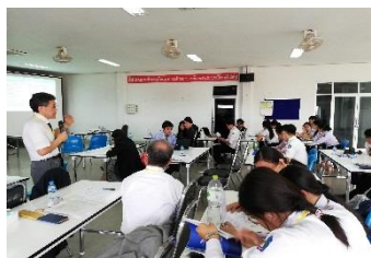
エクスターンシップでの講義風景(2019年2月・ラオス)