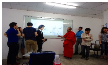
〈2017年3月に実施したエクスターンシップでの授業風景(カンボジア)〉