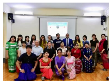
〈海外エクスターンシッププログラム(ミャンマー)の参加学生達(2020年2月・ヤンゴン)〉