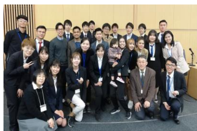
〈PAGLEP連携大学からのワークショップ参加学生と日本人学生(2019年12月・東京)〉