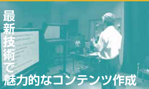
最新技術で魅力的なコンテンツ作成

※当日受付も歓迎致しますが、会場準備の都合上、出来る限り事前申し込みをお願い致します。