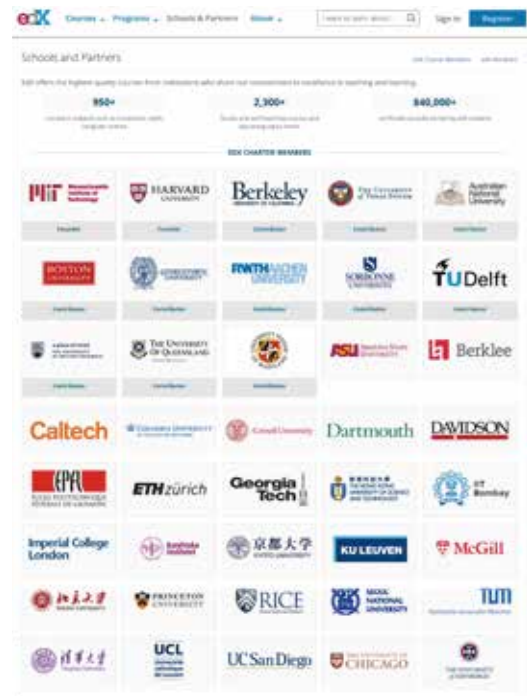
edX の参加校一覧 (部分)

本学では 2013 年の edX 参加、2014 年の KyotoUx として初めての講義公開以来、多くのノウハウを蓄積してきました。MOOC を制作、配信するにあたっては、授業計画の策定段階から講義の撮影、公開、ログデータの収集や分析に至るまで、専門知識をもった制作スタッフのサポートを受けることができます。