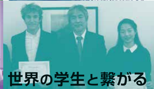
世界の学生と繋がる

本ワークショップでは、「MOOC とは何か」といった基本情報から実際の制作手順、講義を配信した体験談まで、MOOC で講義を配信された経験のある教員や制作スタッフが、MOOC に関する様々な疑問に直接お答えします。